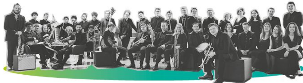
Bundesjazzorchester