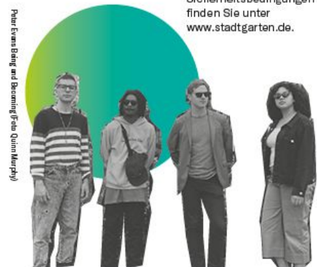
Das Europäische Zentrum für Jazz und Aktuelle Musik wird unterstützt durch:

Alle Angaben sind unter Vorbehalt. Aktuelle Informationen zu den gelten Hygiene- und Sicherheitsbedingungen finden Sie unter www.stadtgarten.de .